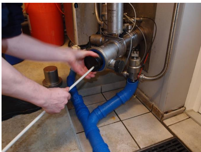
På skru blænd dækslet på udløb