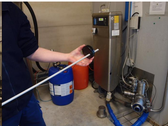
Før røret gennem hullet i blænd dækslen