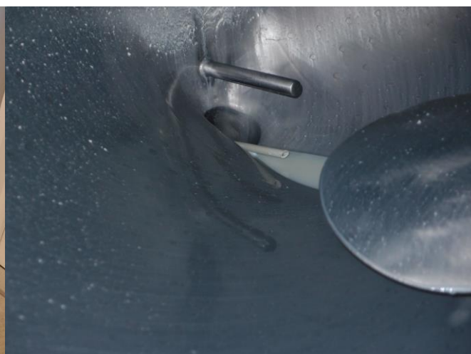
Åben spjæld ventilen og før røret helt ind i tanken