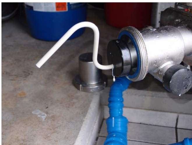
Udtag nu prøve gennem røret