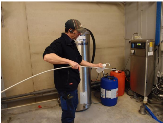
Rengøring og desinfektion udtags røret